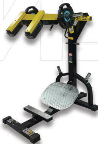
دستگاه هاگ و ساق پا

Weight:55- WIDTH:95- LENGHT:238 - HEIGHT:110