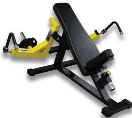
دستگاه قفسه (وزنه آزاد) ↑ BUTTER FLY FREE WEIGHT MACHINES

Weight:55 - WIDTH:125 - LENGHT:130 - HEIGHT:150