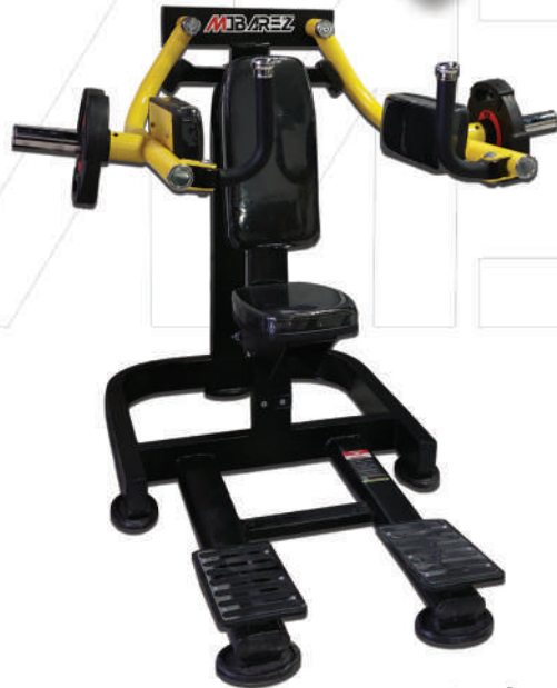
دستگاه نشر تکنو