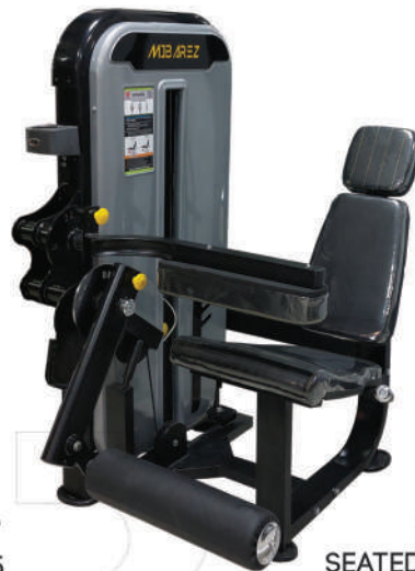
دستگاه پشت پا نشسته دوکاره SEATED LEG CURL EXTENSION T5

Weight:135 - WIDTH:130 - LENGHT:131 - HEIGHT:156