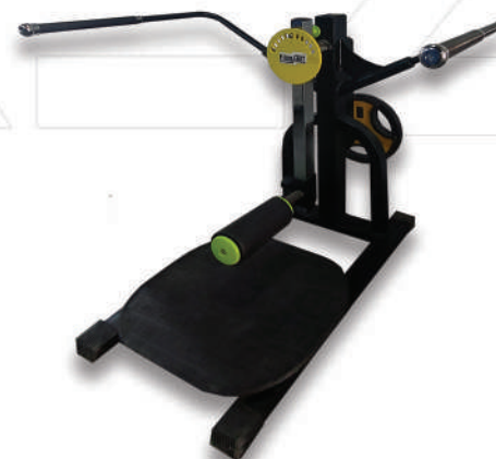
دستگاه خیاط ایستاده وزنه آزاد

Weight:58- WIDTH:117- LENGHT:162 - HEIGHT:158