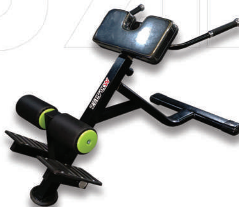
فیله ۴۵ LOWER BACK BENCH 45

Weight:37 - WIDTH:87 - LENGHT:144 - HEIGHT:94