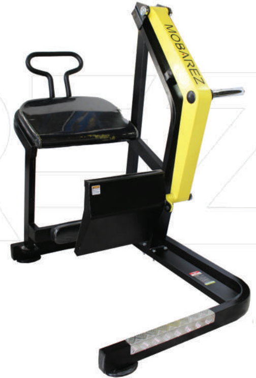
سورنی (کات باسن)

Weight:45 - WIDTH:50 - LENGHT:130 - HEIGHT:80