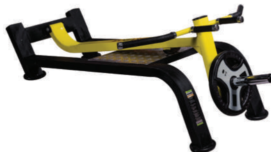
دستگاه تی بارو وزنه آزاد

Weight:45- WIDTH:35- LENGHT:130 - HEIGHT:160