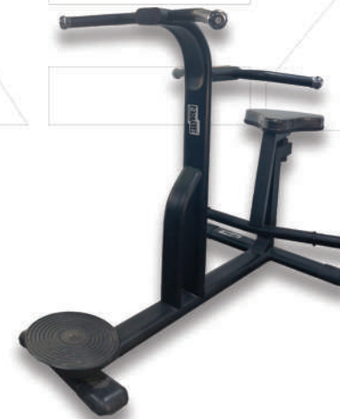
مسگری دوطرفه ROTARY SEATED STAND

Weight:28 - WIDTH:78 - LENGHT:133 - HEIGHT:82