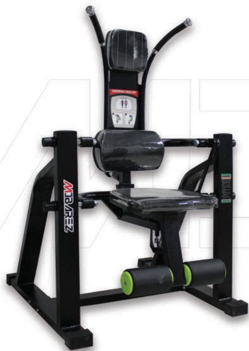
دستگاه شکم کرانچ