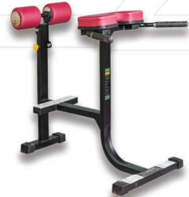
فیله کمر ۹۰ درجه

Weight:18 - WIDTH:25 - LENGHT:25- HEIGHT:30