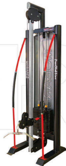
دستگاه نیم کراس (پولی)

Weight:130 - WIDTH:116- LENGHT:145 - HEIGHT:235