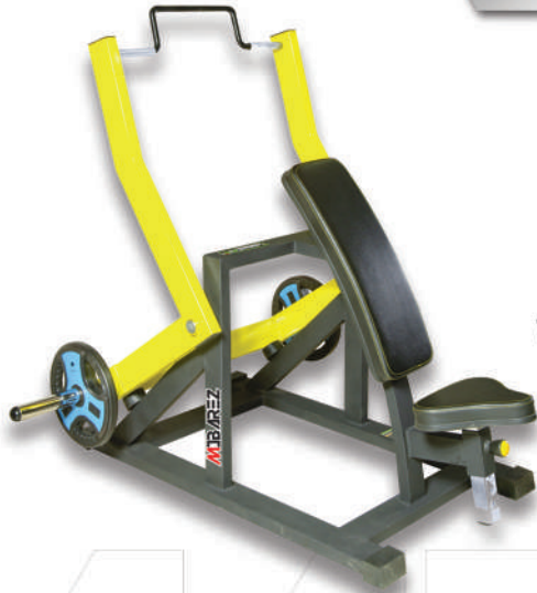
دستگاه پلاور (وزنه آزاد)