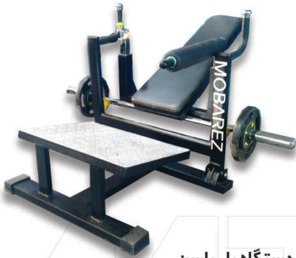
دستگاه پل باسن