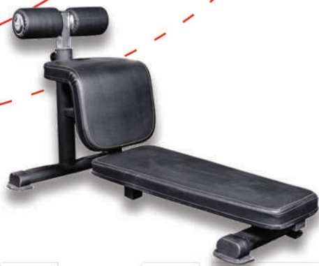
نیمکت شکم کرانچ CRUNCH BENCH

Weight:18 - WIDTH:65 - LENGHT:138 - HEIGHT:80