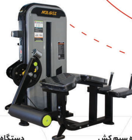
دستگاه پشت پا خوابیده سیم کش LEG CURL MACHINE T5

Weight:142 - WIDTH:107 - LENGHT:103 - HEIGHT:135