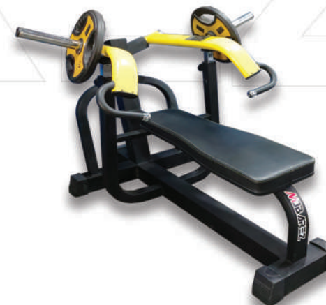
دستگاه پرس سینه مکس (وزنه آزاد) ↑ CHEST PRESS MAX

Weight:57 - WIDTH:134 - LENGHT:155 - HEIGHT:127