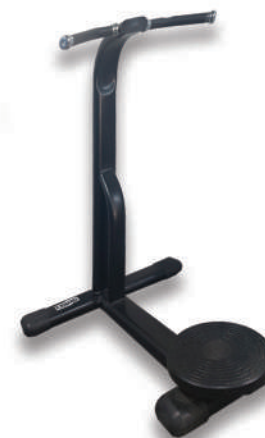
مسگری یک طرفه TWIST

Weight:28 - WIDTH:65 - LENGHT:138 - HEIGHT:80