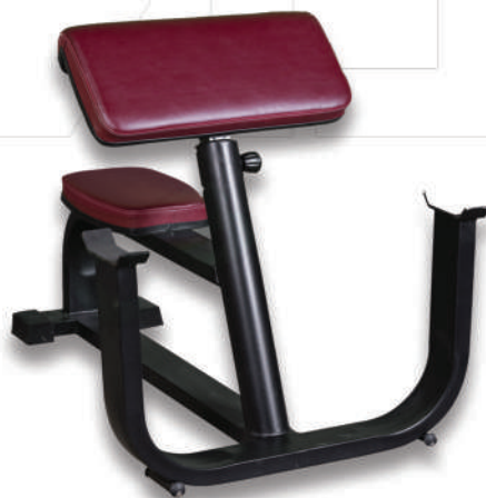
نیمکت جلو بازو لاری BAR PREACHER CURL

Weight:42 - WIDTH:71 - LENGHT:135 - HEIGHT:117