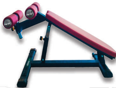
نیمکت شکم مدرج ADJUSTABLE BENCH

Weight:18 - WIDTH:65 - LENGHT:138 - HEIGHT:80