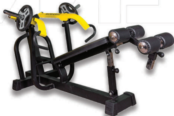
دستگاه زیر سینه مکس (وزنه آزاد) ↑ DCCLINE PRESS MAX

Weight:47 - WIDTH:144 - LENGHT:123 - HEIGHT:100