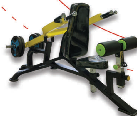
دستگاه پارالل نشسته دیپ

Weight:35- WIDTH:11- LENGHT:146 - HEIGHT:74