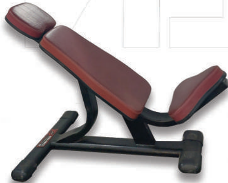
نیمکت بالا سینه ثابت

Weight:61 - WIDTH:140 - LENGHT:130 - HEIGHT:70