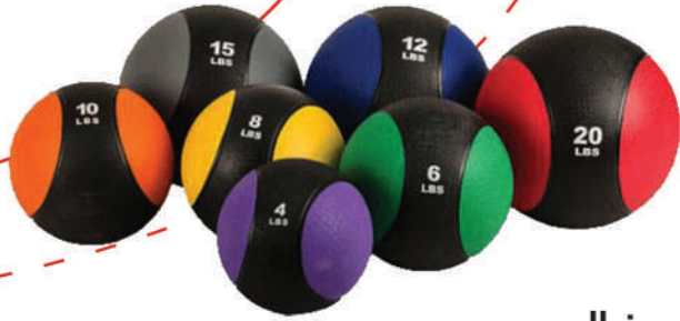
توپ مدیسنبال MEDISANBALL