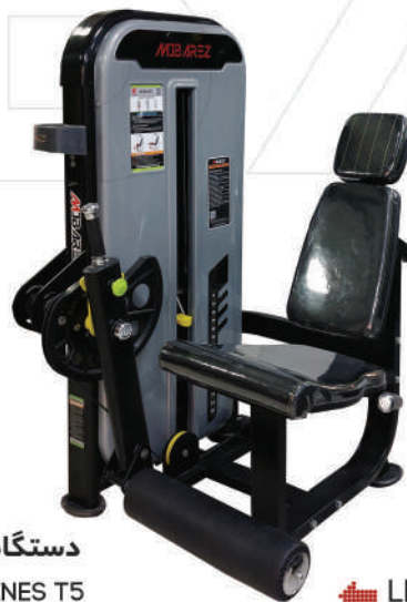
دستگاه جلو پا سیم کش LEVER LEG EXTENSION T5

Weight:131 - WIDTH:100 - LENGHT:101 - HEIGHT:130