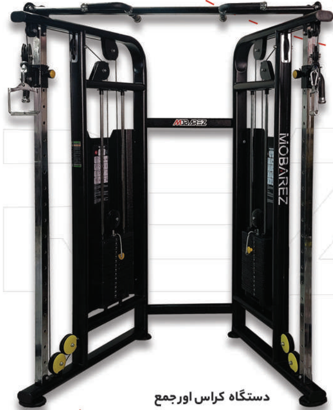
دستگاه کراس اور جمع

Weight:282 - WIDTH:80- LENGHT:373 - HEIGHT:227