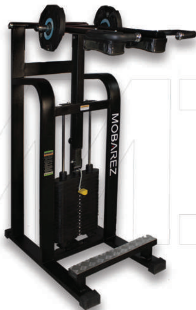
دستگاه ساق پا ایستاده