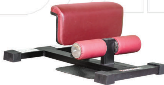
نیمکت اسکات سویسی

Weight:14 - WIDTH:120 - LENGHT:40- HEIGHT:50