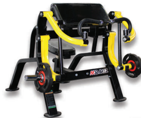
دستگاه جلو بازو وزنه آزاد ↑ PREACHER ARM_LATTY

Weight:53 - WIDTH:135 - LENGHT:155 - HEIGHT:120