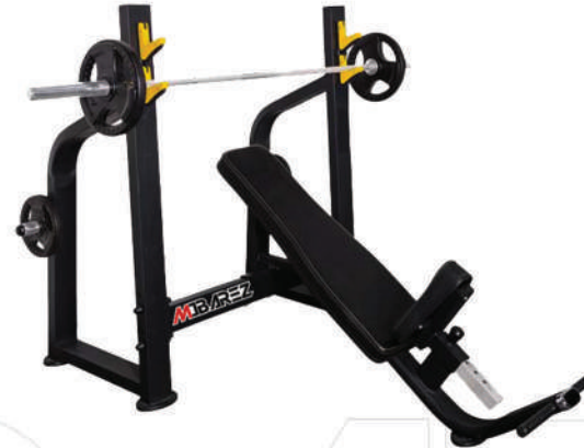
میز بالا سینه

Weight:47 - WIDTH:116 - LENGHT:145 - HEIGHT:235