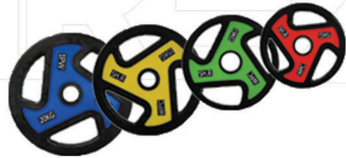
وزنه هالترفرمانی HALTER WEIGHT