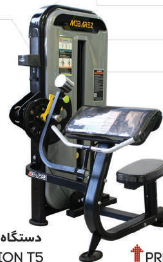
دستگاه جلو بازو سیم کش PREACHER CURL MACHINE T5

Weight:137 - WIDTH:101 - LENGHT:103 - HEIGHT:135