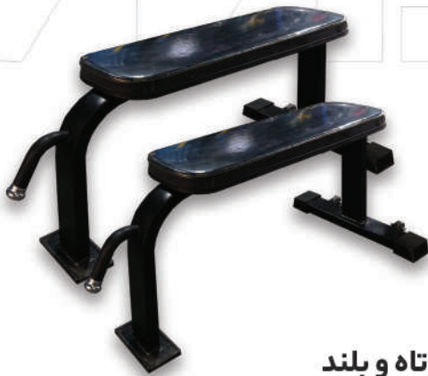
نیمکت کوتاه و بلند

Weight:15 - WIDTH:20 - LENGHT:20- HEIGHT:50