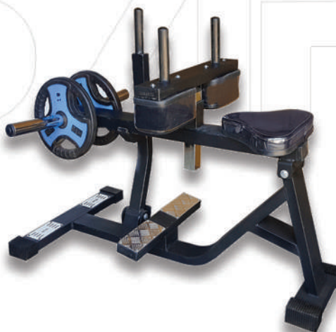
دستگاه ساق پا نشسته

Weight:58- WIDTH:117- LENGHT:162 - HEIGHT:158