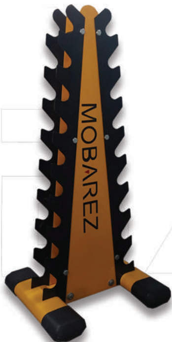
جا دمبل بانوان

Weight:12 - WIDTH:30 - LENGHT:30 - HEIGHT:130