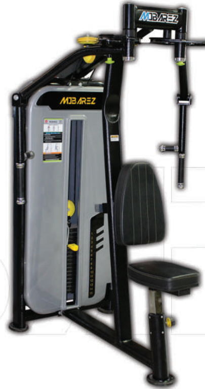
دستگاه قفسه سیم کش

Weight:152 - WIDTH:92 - LENGHT:161 - HEIGHT:216