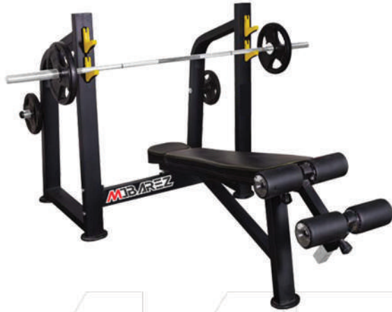
میز زیر سینه