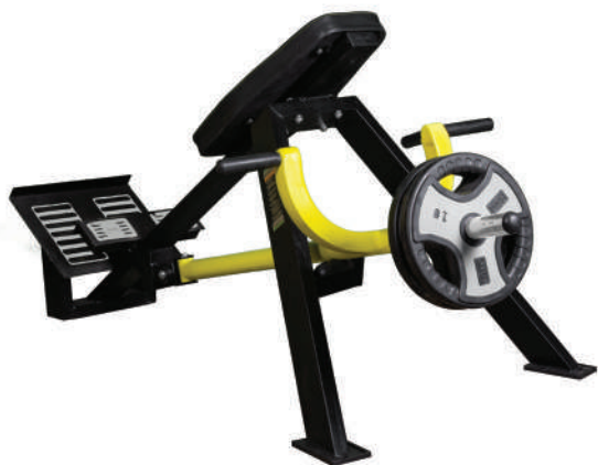
دستگاه تی بارو خوابیده