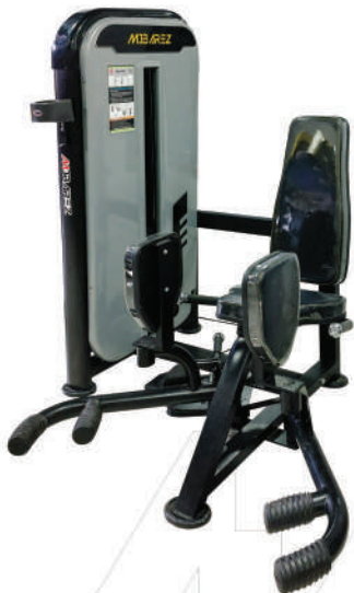
دستگاه خیاط پا سیم کش MULTI HIP ADDUCTION T5

Weight:135 - WIDTH:130 - LENGHT:131 - HEIGHT:156