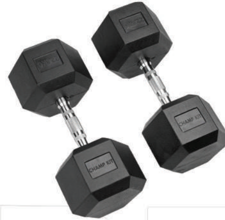
وزنه دمبل DUMBBELLS