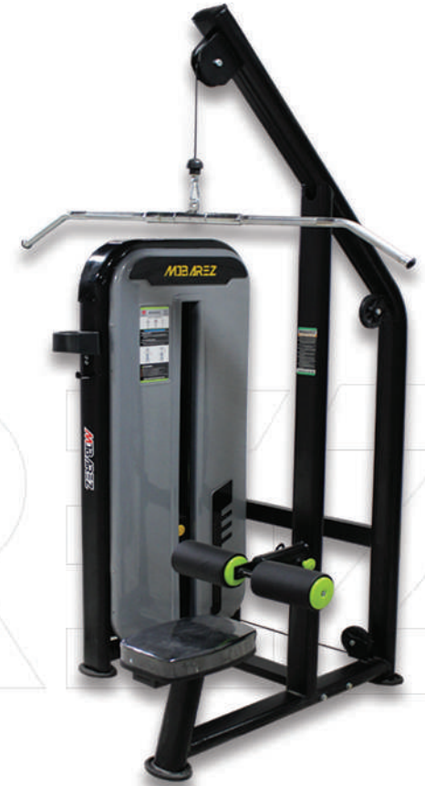
دستگاه زیر بغل سیم کش

Weight:155 - WIDTH:89 - LENGHT:110 - HEIGHT:199