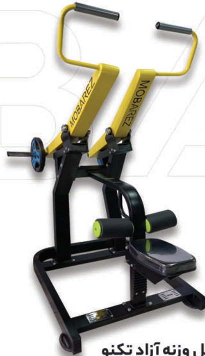
دستگاه زیر بغل وزنه آزاد تکنو