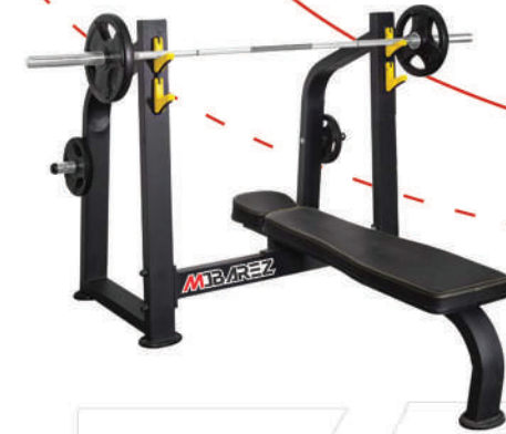
میز پرس تخت

Weight:47 - WIDTH:116 - LENGHT:145 - HEIGHT:235