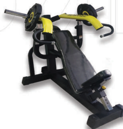
دستگاه بالا سینه مکس (وزنه آزاد) ↑ INCLINE PRESS MAX

Weight:56 - WIDTH:133 - LENGHT:220 - HEIGHT:180