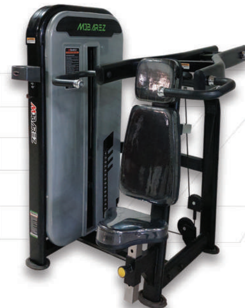
دستگاه سرشانه سیم کش

Weight:140 - WIDTH:90- LENGHT:90 - HEIGHT:235