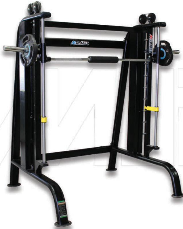
دستگاه اسمیت ماشینی