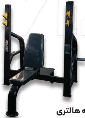
میز سرشانه هالتری

Weight:39 - WIDTH:126 - LENGHT:176 - HEIGHT:125