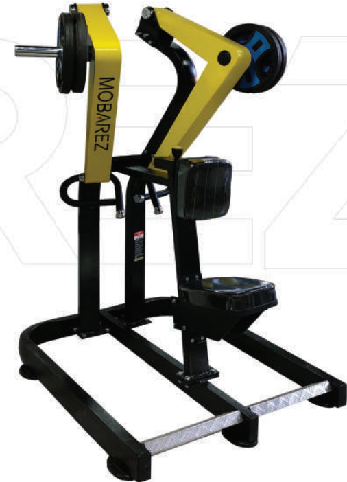
دستگاه قایقی وزن آزاد تکنو