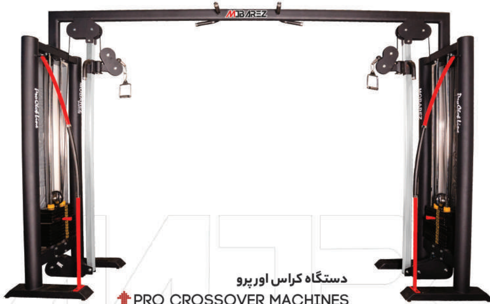
دستگاه کراس اور پرو