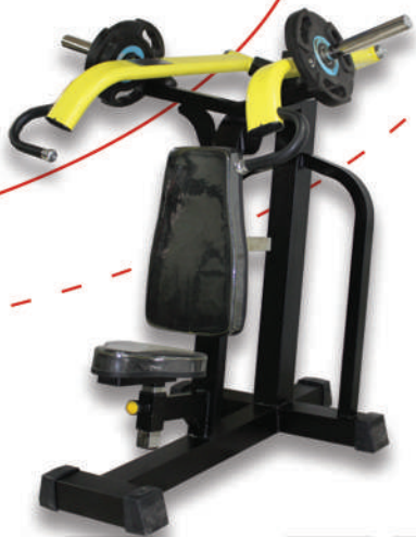
دستگاه سرشانه مکس (وزنه آزاد) ↑ SHOULDER PRESS MAX

Weight:55 - WIDTH:125 - LENGHT:130 - HEIGHT:150