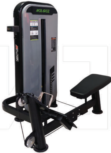
دستگاه قایقی سیم کش