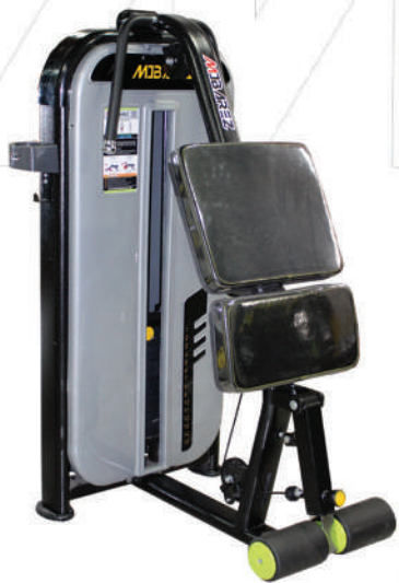
دستگاه پشت پا ایستاده سیم کش STANDING LEG CURL MACHINES T5

Weight:135 - WIDTH:110 - LENGHT:130 - HEIGHT:135