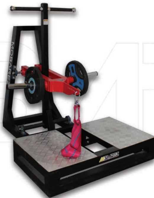
دستگاه برت اسکات

Weight:18 - WIDTH:+65 - LENGHT:138 - HEIGHT:80