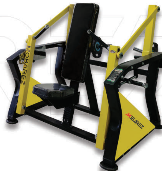
دستگاه پرس و بالا سینه رنجرز

Weight:46 - WIDTH:+150 - LENGHT:140 - HEIGHT:80