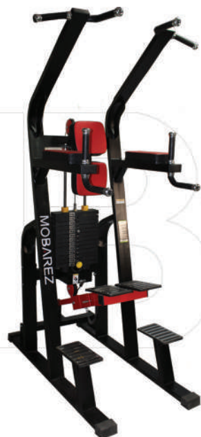
دستگاه بارفیکس کمک دار

Weight:140 - WIDTH:76- LENGHT:152 - HEIGHT:181