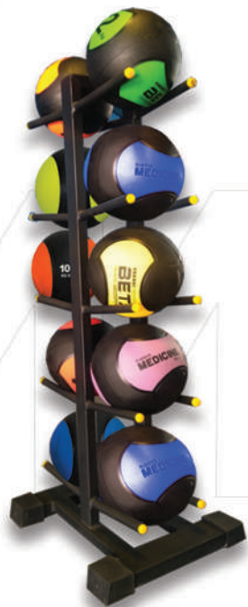
دستگاه جای توپ مدیسنبال