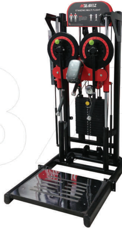
دستگاه نشر سیم کش

Weight:128 - WIDTH:225- LENGHT:128 - HEIGHT:227