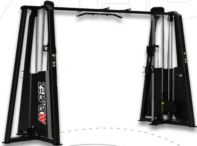
دستگاه صلیب کراس اور دی اچ

Weight:280 - WIDTH:80- LENGHT:373 - HEIGHT:230